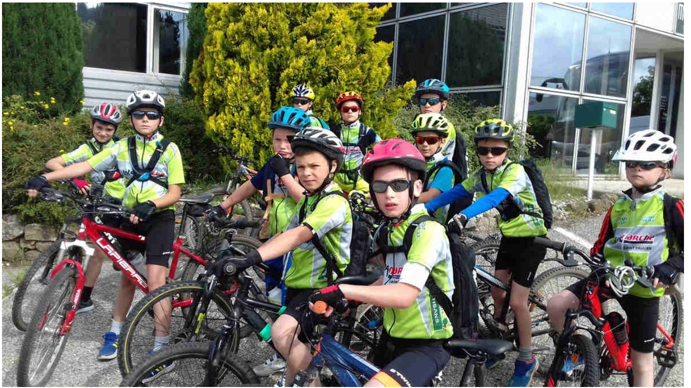
Juin 2018 – Les plus jeunes UCPV au départ de St Agrève, prêts pour 70 km sur la "Dolce Via" jusqu'à La Voulte / Rhône !